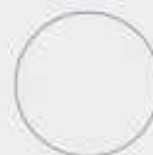
Platinum Silver Metallic